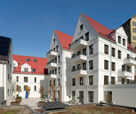
↑ Neubau Wohngebäude mit Gewerbe und Tiefgarage