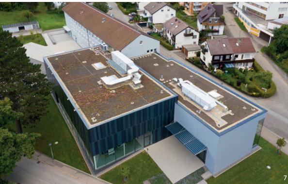
Umbau und Neubau des Campus Schwarzwald

Von Beginn an sind wir dabei in enger Abstimmung mit dem Bauherrn und den beteiligten Planern. Fachliche Baubegleitung und Bauüberwachung sind für uns selbstverständlich.