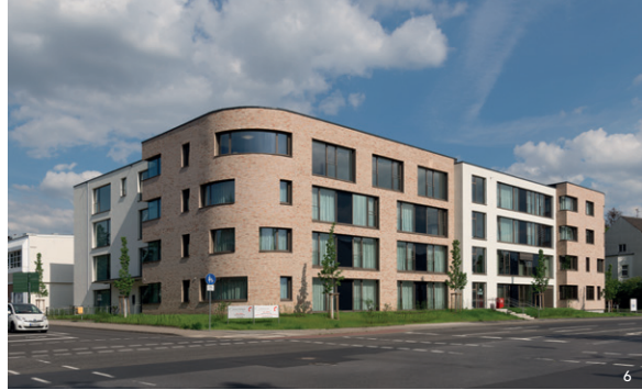
Neubau eines Blindenheims ↑